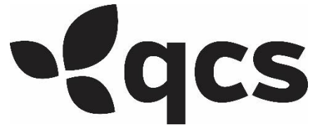
Logotipo simple QCS, blanco y negro