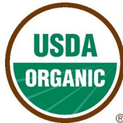
Sello USDA de cuatro colores, con símbolo