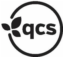
Logotipo circular QCS, blanco y negro