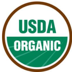
Sello USDA de cuatro colores, sin símbolo