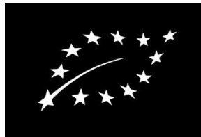
Logotipo Orgánico de la UE, Un Color Oscuro