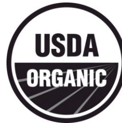
Sello USDA de blanco y negro, sin símbolo