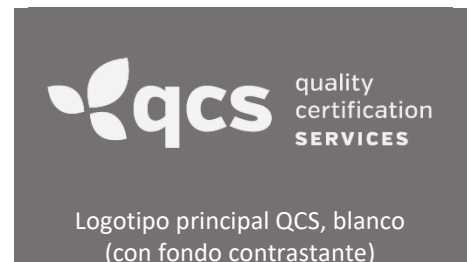
Logotipo principal QCS, blanco (con fondo contrastante)

Todos los productos orgánicos certificados por QCS, tanto en los programas NOP como internacionales, pueden identificarse mediante uno de los logotipos oficiales de QCS. Las entidades certificadas reciben certificados numerados de certificación con el logotipo oficial de QCS. Los logotipos pueden aparecer: